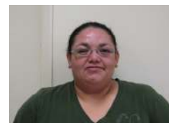
Par Maryse Wapistan